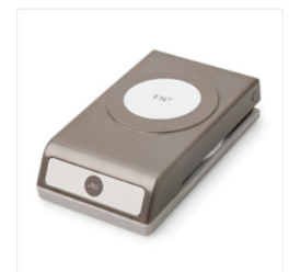
1-3/4" (4.4 Cm) Circle Punch - 119850