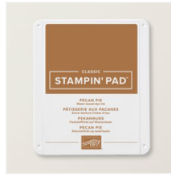
Klassisches Stempelkissen In Pekannuss - 161665