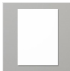
Farbkarton A4 In Grundweiss - 159228