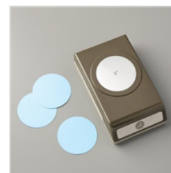
Stanze Kreis 2" (5,1 Cm) - 133782