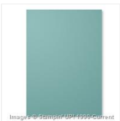
Lost Lagoon A4 Cardstock - 133686