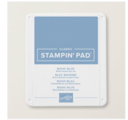
Klassisches Stempelkissen In Boho-Blau - 161650