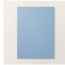
Farbkarton A4 Boho-Blau - 161733