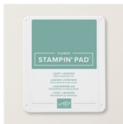
Klassisches Stempelkissen In Lagunenblau - 161678