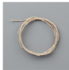
Leinenfaden - 104199