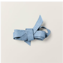
3/8" (1 Cm) Struktur- Geschenkbund In Boho-Blau - 161631