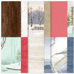
Designerpapier 6" X 6" (15,2 X 15,2 Cm) Schlittenfahrt Im Schnee - 162118