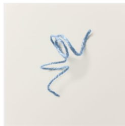
Jute-Kordel In Color 2023-2025 - 161637