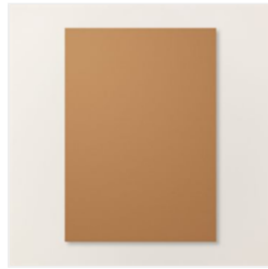
Farbkarton A4 Pekannuss - 161726