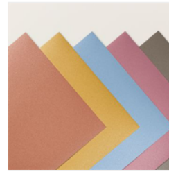
Spezialpapier Mit Seidenglanz 12" X 12" (30,5 X 30,5 Cm) In Color 2023–2025 - 161746