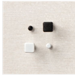
Runde Und Viereckige Spreizklammern - 155570