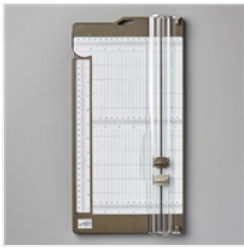
Papierschneidemaschine - 152392

katja@machsdirschoen.info www.machsdirschoen.info