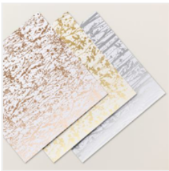
Besonderes Designerpapier 12" X 12" (30,5 X 30,5 Cm) Glanzvolle Natur - 161639