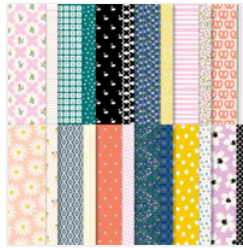
Designerpapier 12" X 12" (30,5 X 30,5 Cm) Einfach Eklektisch - 161640