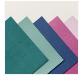
Dezent Schimmerndes Spezialpapier 12" X 12" (30,5 X 30,5 Cm) - 161750